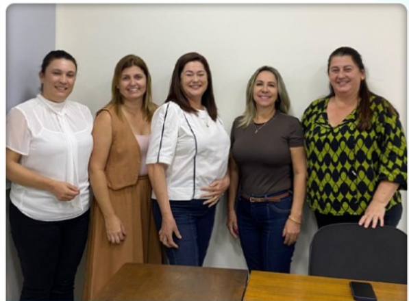
27 DE MAIO | REUNIÃO DO MÚLTIPLO MULHER O Múltiplo Mulher realizou alinhamentos sobre a nova turma do Liderança Social, com confirmação do cerimonial de abertura e encerramento, além do retorno dos participantes convidados.