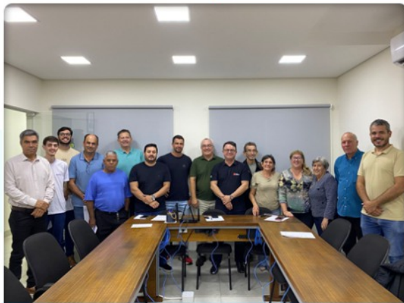
25 DE MAIO | ENCONTRO PROJETO CIDADANIA Foi realizado o encontro do Projeto Cidadania, com diálogo e construção coletiva para fortalecer a participação social e a retomada do projeto.