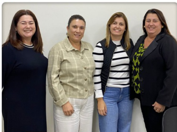
13 DE MAIO | REUNIÃO DO MULTIPLIC MULHER O Multiplic Mulher realizou alinhamentos sobre as confirmações dos participantes, sugestões de novos nomes para a próxima etapa e definições dos facilitadores da 3ª turma do Liderança Social.