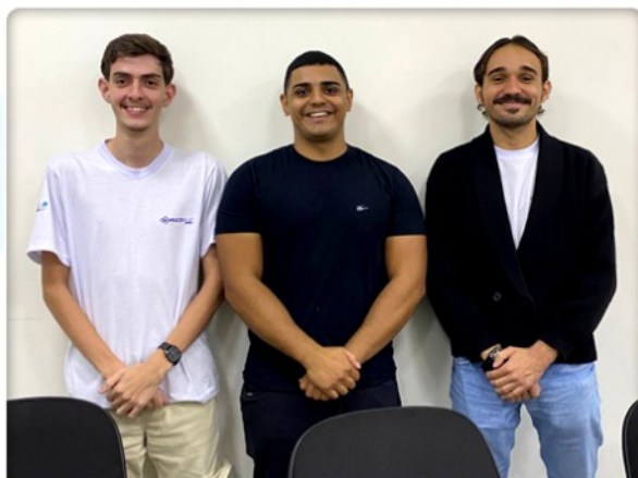
12 DE MAIO | REUNIÃO DO MULTIPLIC JOVEM O Multiplic Jovem realizou reunião de alinhamento sobre o andamento do projeto Impulsionando Jovens Carreiras 6ª turma. Também foi definida a continuidade do Voluntariado Jovem em ações do Multiplic.