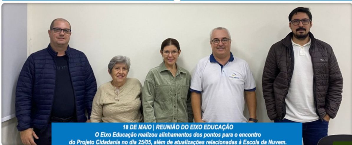
18 DE MAIO | REUNIÃO DO EIXO EDUCAÇÃO O Eixo Educação realizou alinhamentos dos pontos para o encontro do Projeto Cidadania no dia 25/05, além de atualizações relacionadas à Escola da Nuvem.