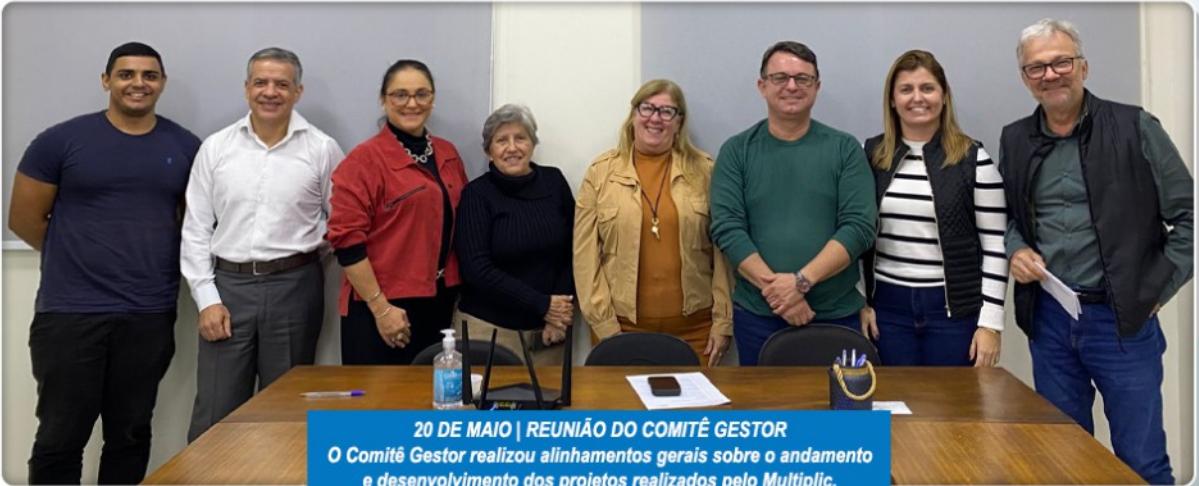
20 DE MAIO | REUNIÃO DO COMITÊ GESTOR O Comitê Gestor realizou alinhamentos gerais sobre o andamento e desenvolvimento dos projetos realizados pelo Múltiplo.